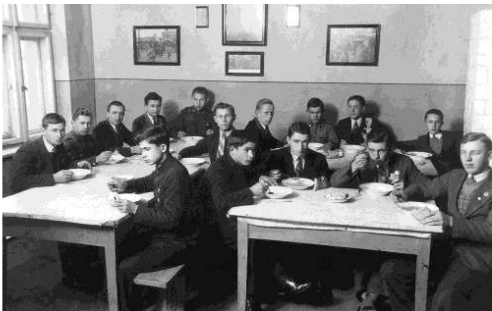
zdjęcie 5 - bursa szkolna utworzona w 1927 roku mieszcząca się przy ulicy Łęczyckiej 4