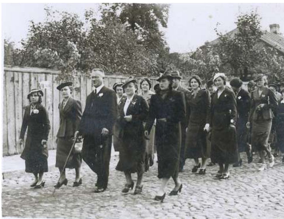
zdjęcie 8 - uroczysty przemarsz ulicami Zgierza z okazji I Zjazdu Absolwentów w 1937 roku