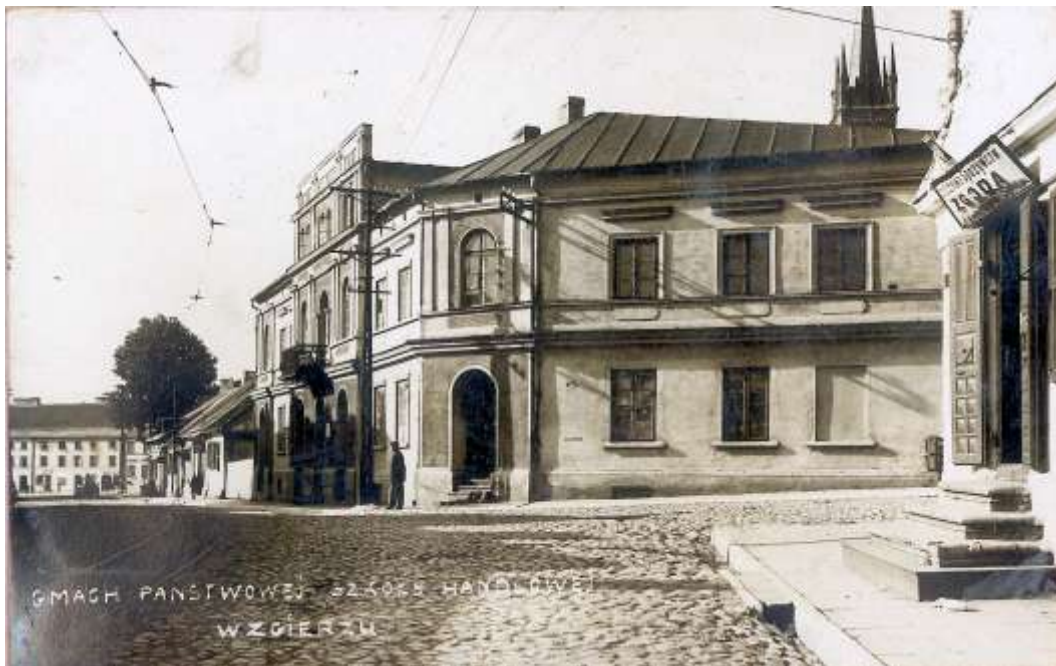
zdjęcie 3 - pierwszy budynek szkoły przy ulicy łęczyckiej 5 (od 1919 do 1945 roku)