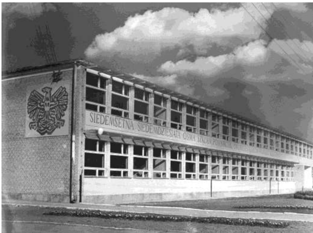
zdjęcie 13 - obecny budynek szkoły otwarty 19 września 1964 roku.