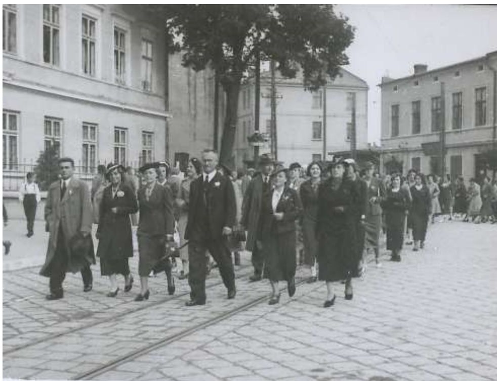
zdjęcie 7 - uroczysty przemarsz ulicami Zgierza z okazji I Zjazdu Absolwentów w 1937 roku