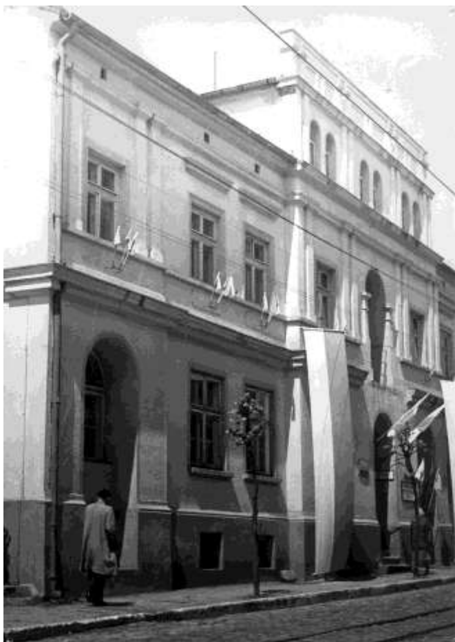
zdjęcie 9 - drugi budynek szkoły przy ulicy 17 Stycznia 47 (obecnie Długa) – od 1945 do 1964 roku