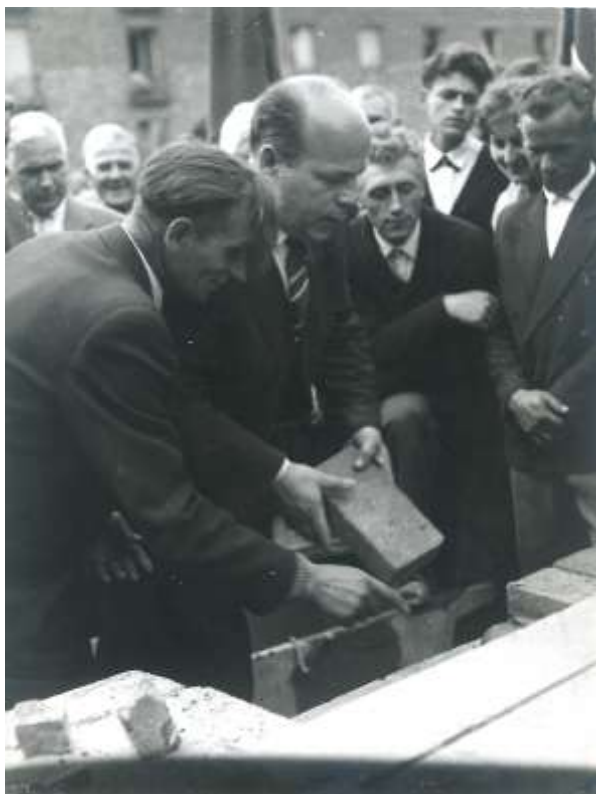
zdjęcie 12 - 19 lipca 1962 - na placu budowy przy ulicy 17 stycznia 89/91 (obecnie Długa 89/91) odbyła się uroczystość wmurowania aktu erekcyjnego