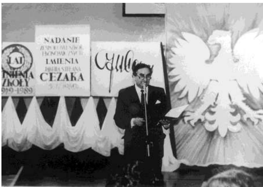
zdjęcie 16 - 5 kwietnia 1989 rok - uroczystość nadania Szkole imienia Jakuba Stefana Cezaka