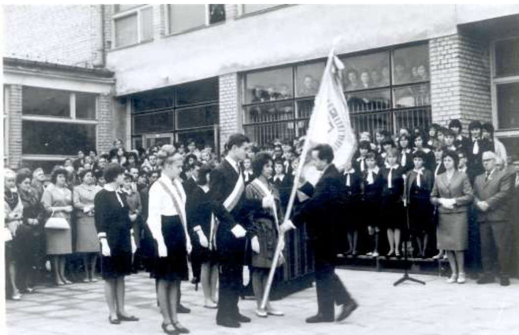
zdjęcie 14 - 2-3.10.1965 r. - III Zjazd Absolwentów. Uroczystość przekazania nowego sztandaru Szkoły ufundowanego przez absolwentów