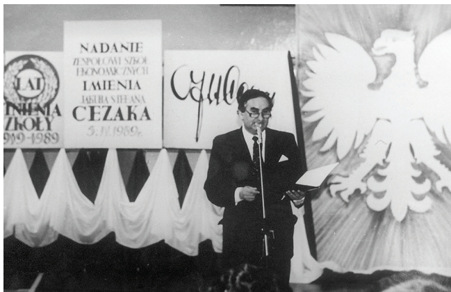
Ówczesny kurator oświaty odczytuje akt nadania - 5 kwietnia 1989

30 września 1988 roku Ministerstwo Edukacji Narodowej wydało zgodę na nadanie szkole imienia Jakuba Stefana Cezaka.