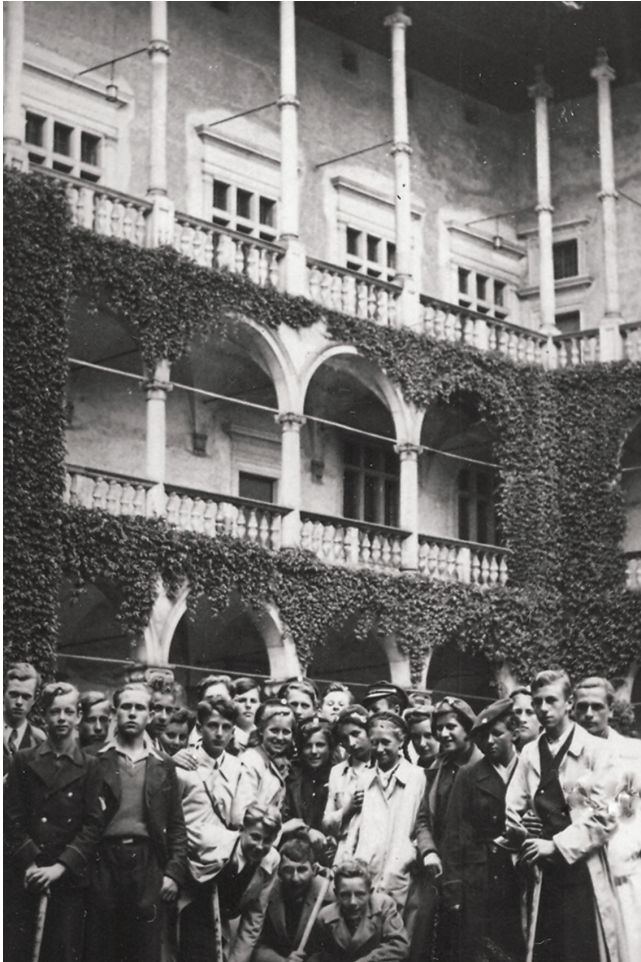
Klasa III A, rocznik 1939/40, na wycieczce w Krakowie - 1932