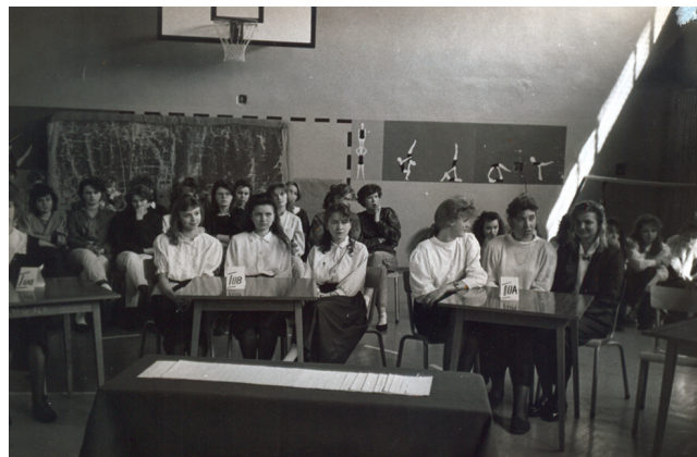
I Konkurs Wiedzy o Patronie i Historii Szkoły - 1990